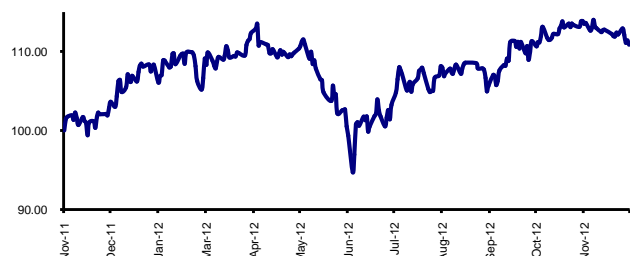
Kinerja Maestro Equity Syariah Rupiah