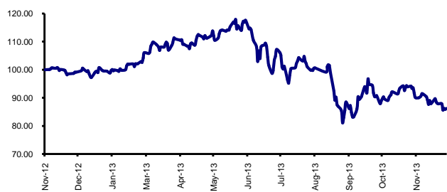
Kinerja Maestro Equity Syariah Rupiah