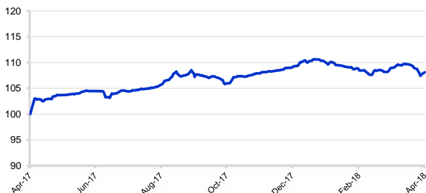
Kinerja Secure Money