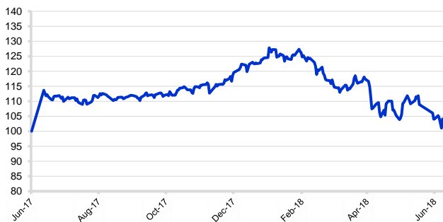
Kinerja Dynamic Money