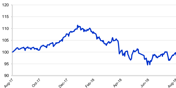
Kinerja Progressive Money